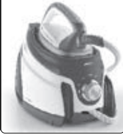
POLTI LA VAPORELLA XM82 / 80C