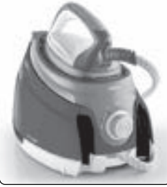
POLTI LA VAPORELLA XT90C