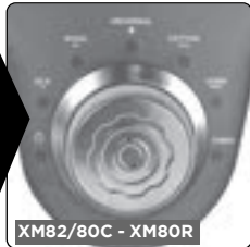
XM82/80C - XM80R