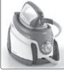
POLTI LA VAPORELLA XT110C / XT100C